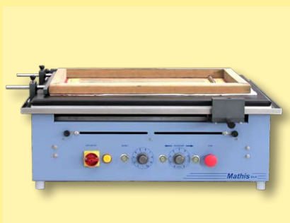
quadro com barra eletromagnética

A aplicação pode ser feita repetidas vezes, nos dois sentidos, ida e volta.