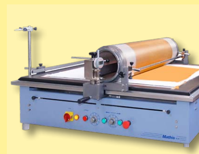
cilindro com faca de borracha